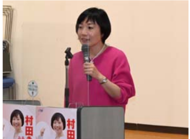
懇談会 in 佐久で決意表明